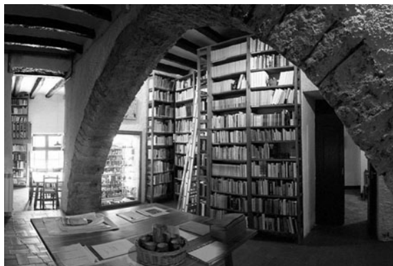
Biblioteca Curtó. Fundació Marta Mata

Ens agradaria que aquesta tertúlia animés totes les escoles a 'mimar' la seva biblioteca.