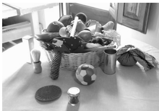
La panera dels tresors