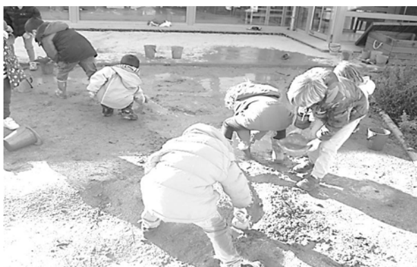
Jugant al pati de l'escola Piquedines, de Taradell

D'altra banda, en cap moment van citar que sempre hi ha hagut escoles i mestres que han fet un ensenyament actiu, que té en compte l'alumnat i les seves necessitats.