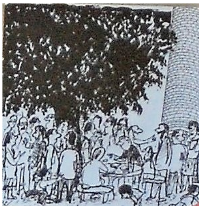
Dibuix de Cesc a la portada del llibre 'Ai que bé', recull de textos dedicats d'amics i amigues, amb motiu del 70è aniversari de Marta Mata, l'any 1996

Cal fer un nou camí de relació Moviments de Renovació Pedagògica–Administració Educativa, però l'important no és el moviment ni el camí, sinó la càrrega de Renovació Pedagògica que s'hi vehicula i, potser encara més, la disposició amb què s'aconsegueix fer-la arribar a totes les escoles i tots els infants.