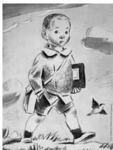
Cartell de l'Associació Protectora de l'Ensenyança Catalana, fundada a finals del segle XVIII.

Als monitors de lleure se'ls fa molt difícil pensar en treballar sols; sempre ho comparteixen tot: objectius i mètodes i se sorprenden que en el cas dels mestres no sempre sigui així. La formació dels educadors de lleure ja es fa en comú. Els responsables dels monitors de la casa de colònies Cal Mata, per exemple, constaten que els mestres més grans són més participatius i renovadors que els joves en les activitats amb els infants. I aquesta actitud es dona tant a les colònies com a l'escola.